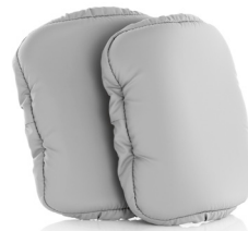
Lisävarusteena säärivien pehmuste

CE MD TurnSafe2 täyttää lääkinällisten laitteiden asetuksen 2017/745 luokan 1 tuotteille asetetut vaatimukset.