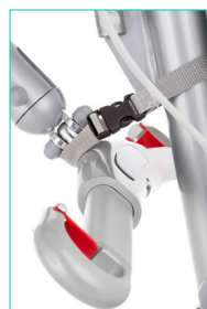
Nostovarsi taitetaan alas ja kiinnitetään tukevasti mastoon kiristysriihillä.