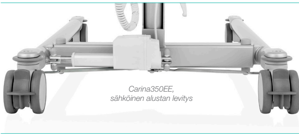
Carina350EE, sähköinen alustan levitys