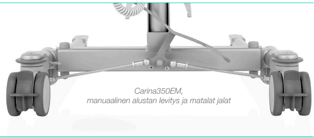
Carina350EM, manuaalinen alustan levitys ja matalat jalat