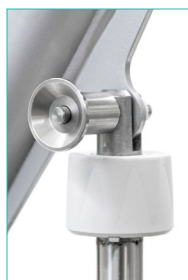
Toimilaitte irrotetaan nostovarresta pikalukitustapin avulla.

Carina350 on kokoontaitettava ja vaatii vain vähän tilaa kuljetuksen ja varastoinnin aikana. Carina350 voidaan pystyttää ja taittaa kokoon tarpeen mukaan muutamalla yksinkertaisella toimenpiteellä ja ilman työkaluja. Nostin toimitetaan kokoontaitettuna.